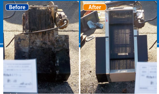
▲微細目スクリーンの交換前(左)と交換後(右)

中・大型浄化槽の省エネ化を促進する、省エネ型浄化槽システム導入推進事業（二酸化炭素排出抑制対策事業費等補助金※以下、本補助金）。申請件数が初年度の約2.5倍となった平成30年度には、約1,526tの二酸化炭素削減に貢献。対象範囲と予算がさらに拡大した本年度の詳細を紹介。