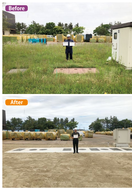
▲浄化槽本体の交換