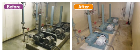
▲ばっ気ブロワの交換