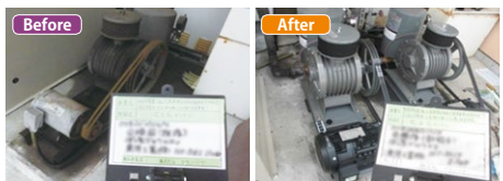
▲ばっ気ブロワの交換