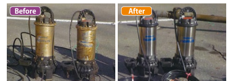
▲循環ポンプの交換