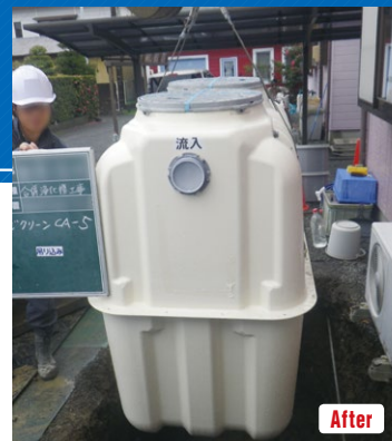
▲新設される合併浄化槽