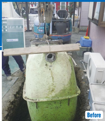
▲掘り出した単独浄化槽

トイレの水洗化を図る排水処理装置として、全国に普及した単独浄化槽。しかし、生活雑排水を未処理で垂れ流してしまうため、環境への悪影響が懸念される。合併浄化槽への転換が努力義務と定められた平成12年度以降、単独から合併への転換を促すさまざまな助成制度が拡充。その歴史を追った。