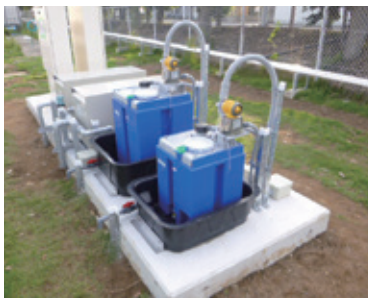
▲窒素除去を安定化させる為の有機炭素源（メタノール）とアルカリ源（水酸化ナトリウム）の添加設備

環境マネジメントシステム（ISO14001）を基に環境省が策定したエコアクション21。どちらも認証を受けるためには、環境リスクの低減及び環境への貢献を具体的に示す必要がある。排水処理設備の導入もその一つ。フジクリーンの高度処理型浄化槽、CRX-Gは、環境への