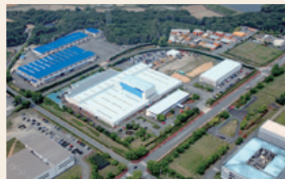
▲新明和工業株式会社 小野工場