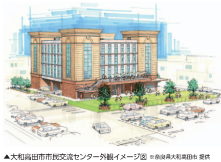
▲大和高田市市民交流センター外観イメージ図

市の中核部で平成28年3月の完成を目指し、市民交流、高齢者交流・相談、子育て支援などの機能をもつ「市民交流センター」(仮称)の建設が進められている。