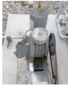
▲ロータリープロワ特有のオイル汚れ

他にもロータリー式には運搬・設置時に重量の問題があった。1台50kg前後となるため、厚生労働省の「職場における腰痛予防対策指針」によれば、施工時には2人以上の作業となる。また、維持管理時のオイル補充やオイル漏れへの対応も必要であった。EcoMac a cシリーズはこれらの問題も解決できる。